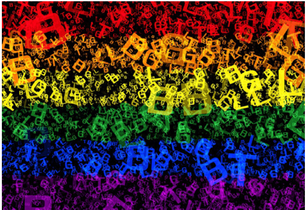
Imagen seleccionada por el equipo editor del boletín. Enlace con técnica de acortamiento

Infelizmente, la mayoría de las instituciones educativas son las primeras en inhibir los derechos humanos y fundamentales de la población transgénero; aún se tolera la discriminación, no se le permite el libre acceso a la educación real y no se establecen parámetros para impedir las agresiones a su integridad física y su vida, en general. Todavía no hay una conciencia plena de que la tarea de los centros