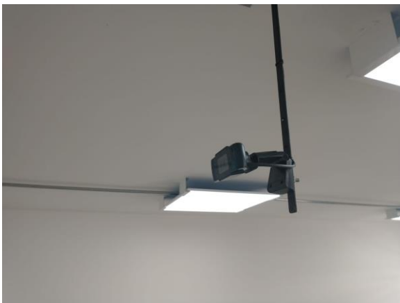
Cámara de alta definición

En cuanto a equipos ingresaron dos pc para las direcciones de los programas de Medicina Veterinaria y Derecho, además se adecuaron los salones 302, 303, 402 y sala de audiencias con cámara de alta definición y sistemas de audio(micrófono).