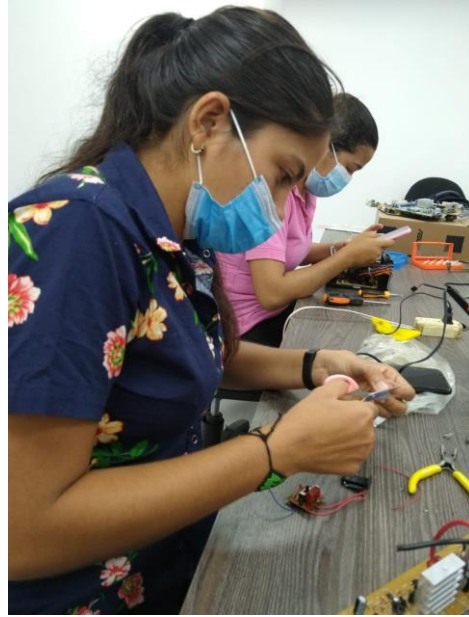
Estudiantes desarrollando actividades del semillero de investigación

Docentes participantes en actividades con semilleros de investigación